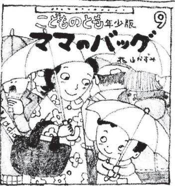
こどものとも年少版 2016年9月号

せせせせせに登場するたかくんのモデルはこの絵本を担当してくれた編集者の下さんです。学生時代はサッカー部だった体育会出身の頼れる編集者さん